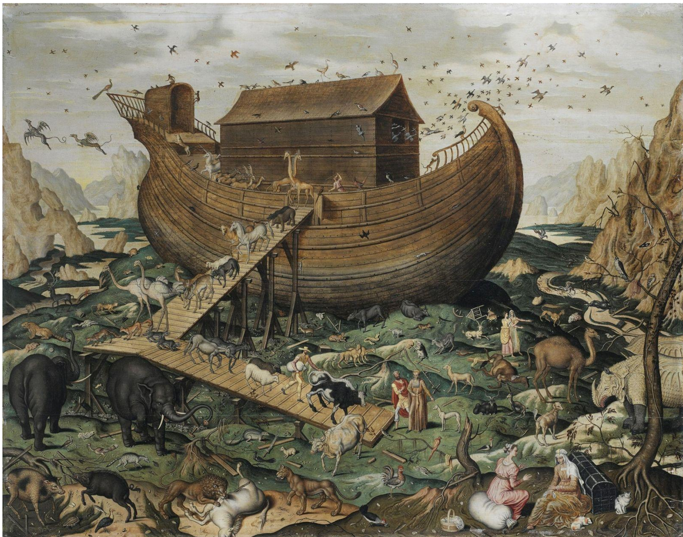
Con tàu Noe và các loài vật được đưa lên tàu trước nạn hồng thủy