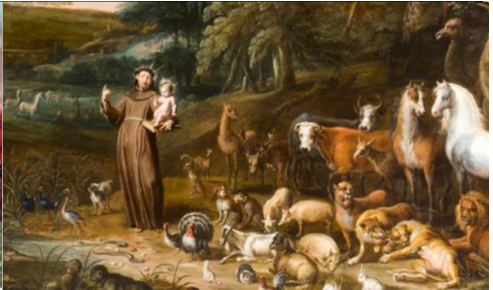
Thánh Phanxi cô Assisi và các loài vật

4. Các vị thánh và sự bảo trợ: Động vật được liên kết với các vị thánh cụ thể và có thể tượng trưng cho đức tính hoặc thuộc tính của các ngài, hoặc thậm chí một số chi tiết về tiểu sử của chính vị thánh đó. Ví dụ, Thánh Anton ần tu, Vị thánh Ai Cập đã trở thành vị thánh bảo trợ của những người chăn heo do mối quan hệ được báo cáo rằng một con heo anh có nhắc nhở anh các giờ trong ngày để anh ta cầu nguyện. Vì vậy, anh ta thường được nhìn thấy với một chú heo.